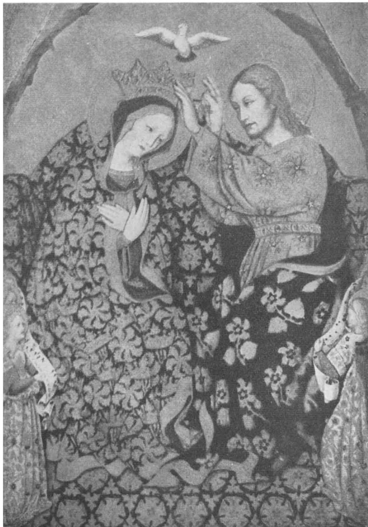
Gentile da Fabriano. Kroning van Maria