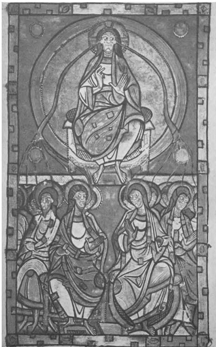
Pinksteren. Sacramentaire de Limoges